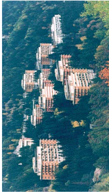
STRUTTURA "OSPEDALE MORELLI" - REGIONE LOMBARDIA - SONDALO

Sondalo si trova in Alta Valtellina ad una quota di metri 940 s.l.m. ed è facilmente raggiungibile da più punti: - da Milano lungo la Super Strada 36 fino a Colico e poi proseguendo in direzione Sondrio Tirano Sondalo; - dalla Valcamonica attraverso il passo dell'Aprica scendendo fino a Tresenda poi proseguendo verso Tirano Sondalo; - da Merano (BZ) oltrepassando il Passo dello Stelvio scendendo a Bormio e proseguendo per Sondalo - dalla Svizzera attraverso il Passo dello Spluga scendendo lungo la Val Chiavenna fino al Trivio di Fuentes e poi proseguendo direzione Sondrio Tirano Sondalo. - attraverso il Passo del Bernina fino a Tirano e poi lungo la statale fino a Sondalo.